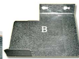
Suplemento tapa reserva VA316