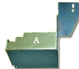
Protector desviador VA316