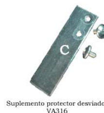
Suplemento protector desviador VA316